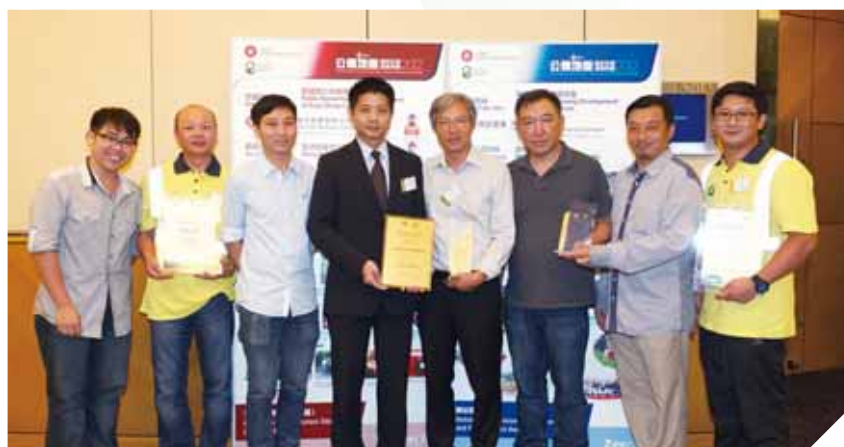
2012年公德地盤嘉許計劃頒獎禮

可以測量碳排放對環境的實質影響。集團於2013年取得ISO 14064認證，該認證列明量化和報告溫室氣體排放的原則及要求，並審核辦公室及四個建築工地的實地基建、活動、技術及處理方法。