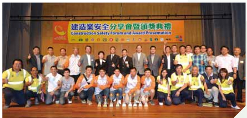
建造業安全分享會暨頒獎典禮

工嚴格執行安全第一的守則。瑞安建業設立安全獎勵計劃，嘉許安全模範工友，另設有紅／黃牌紀律制度。