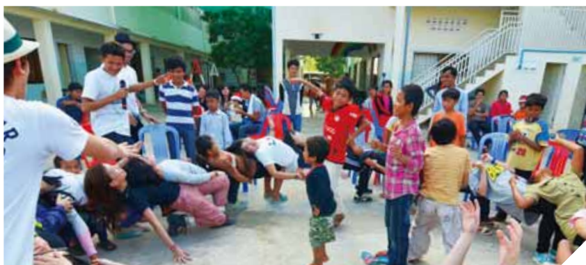
贊助「非常旅人任務」