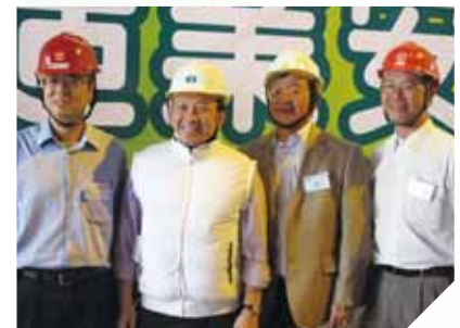
冷凍衣推廣先導計劃

我們定期檢討安全施工程序，積極提升現有質素，並遵守OHSAS 18001職業健康及安全管理系統，確保員