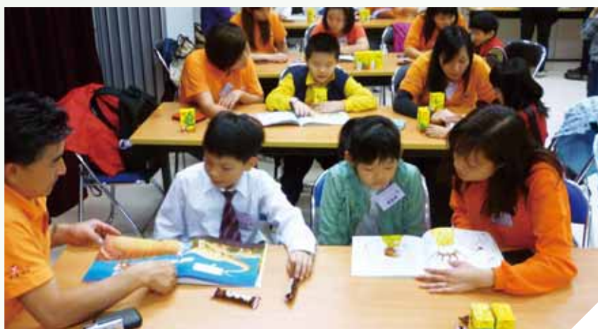
為有讀寫障礙的兒童進行伴讀活動

青少年發展是集團重點關注的一環，透過提供學習機會增強青少年的自信，提升個人發展，協助社會培養未來領袖。我們持續推動青少年服務，多年來支持不同機構舉辦的師友計劃，又提供海外交流的機會，讓他們藉著旅遊開拓視野。